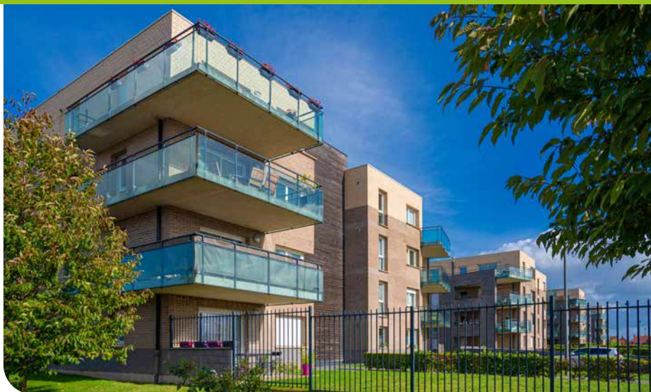
Programme de logements à Hem

Réviser un PLU est une démarche transversale qui interroge et prend en compte les enjeux des différentes politiques de l'aménagement métropolitain. Il s'agit de répondre aux besoins du territoire tout en tenant compte des grands enjeux environnementaux.