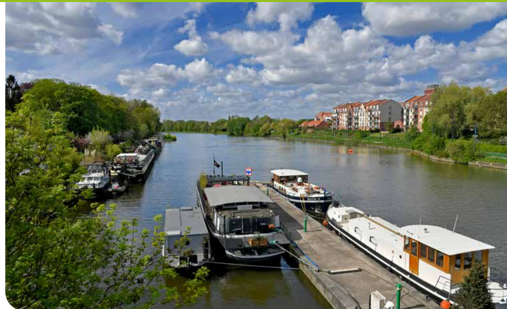
Port de Wambrechies

La révision générale du PLU poursuit l'objectif de s'intégrer dans un processus de résilience territoriale d'une part et de poursuivre la préservation des secteurs concernés par les aires d'alimentation et de captage des eaux pluviales (AAC).