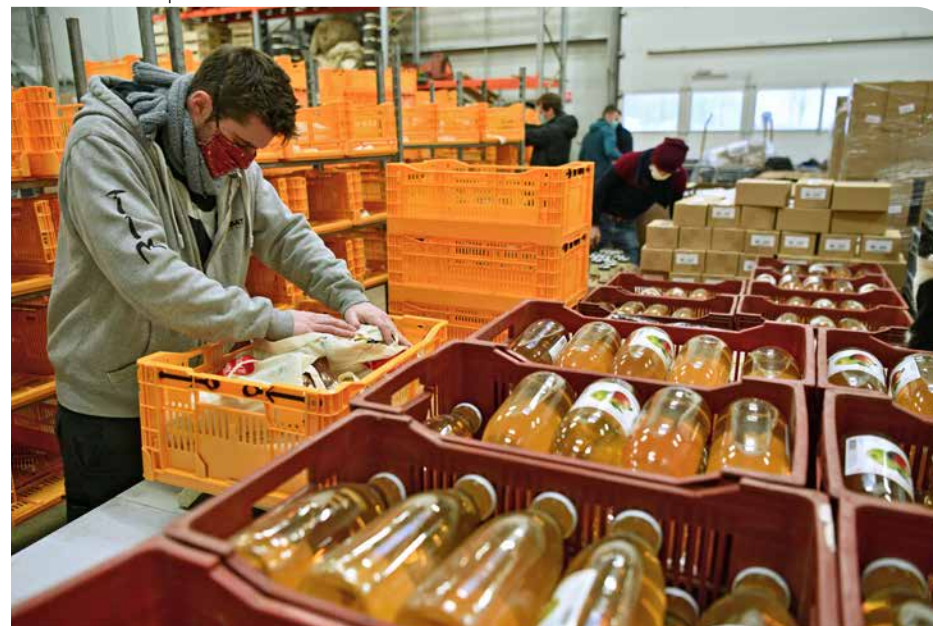
Mise en sac de produits locaux à Lille