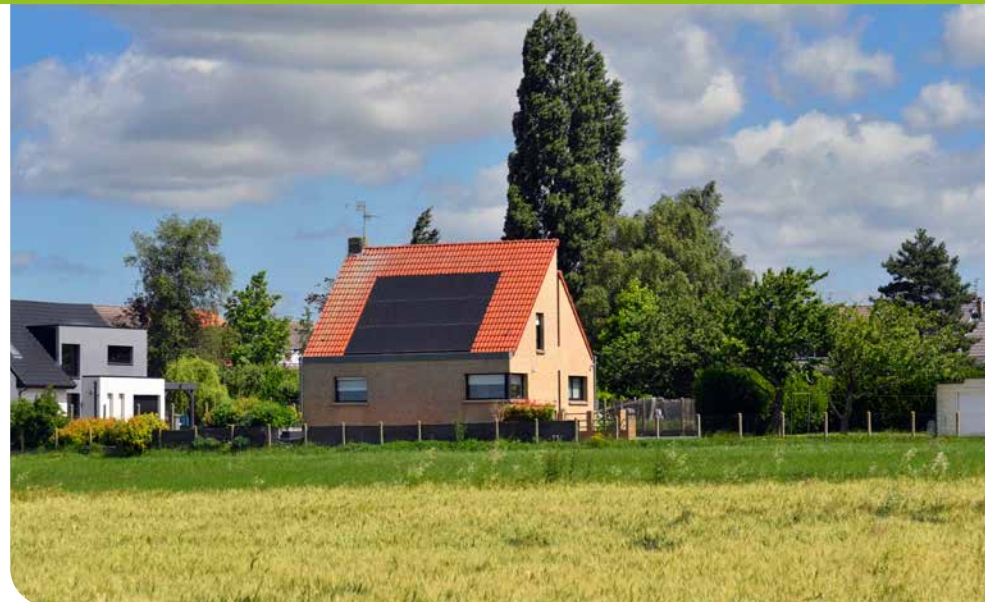
Installation de panneaux photovoltaïques à Linselles

De nombreux enjeux et outils réglementaires ont déjà été intégrés dans le PLU2 en vigueur. La révision générale des PLU poursuit l'objectif de renforcer encore l'intégration du PCAET.