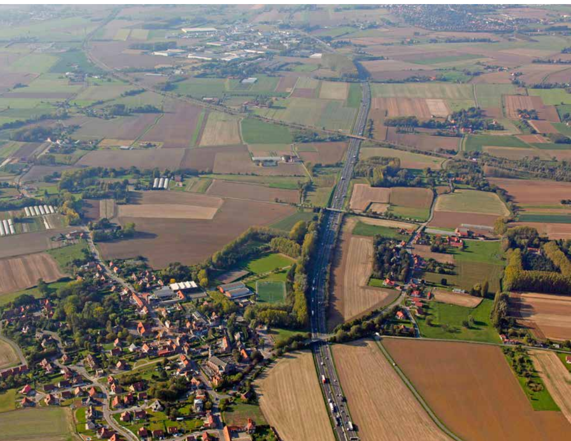
Vue aérienne d'Ennetières-en-Weppes